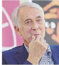
Separati in casa Matteo Renzi e Giuliano Pisapia