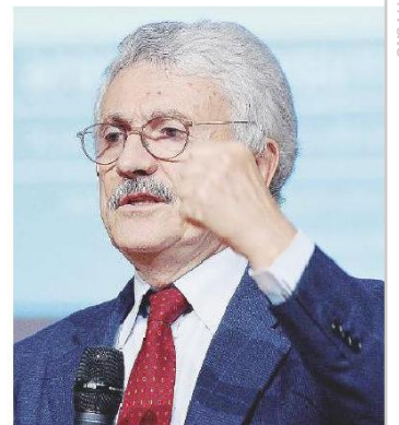
Il Líder Massimo D'Alema

Santi Apostoli Il comizio di Giuliano Pisa- pia a Roma per il lancio di “Insieme” con Bersani e Mdp